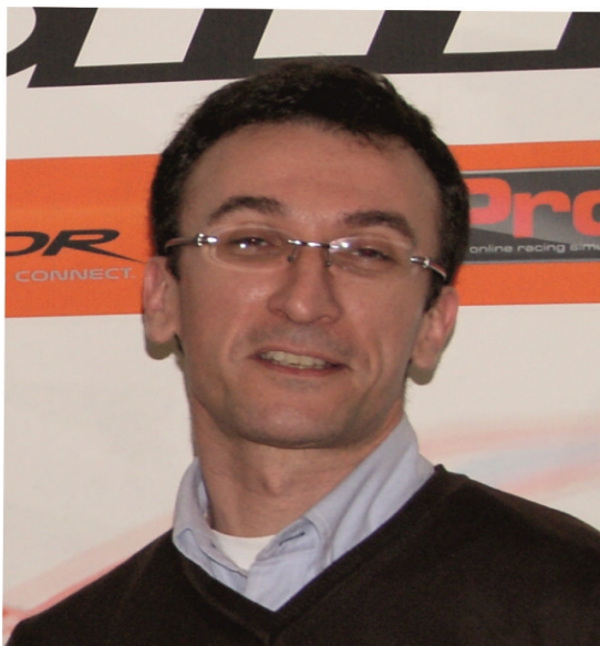
Foto oficial do responsável pelas Relações c/os concorrentes