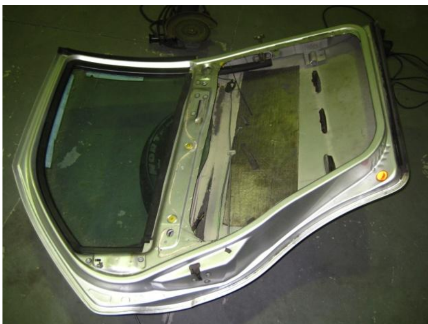
Figura 3 - Porta traseira após remoção do interior e chapa interior.

Todo o interior das portas traseiras pode ser retirado, figura 3.