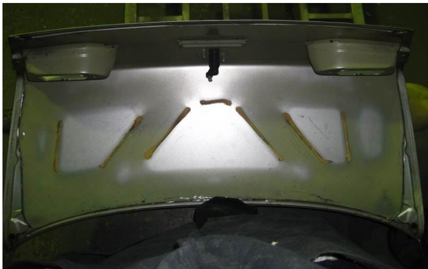
Figura 4 - Tampa da mala após remoção da chapa interior.

Na tampa da mala pode ser retirada toda a chapa interior e dobradiças, Figura 4. Nesta situação terão de ser montado um sistema de fixação da mala em quatro pontos.