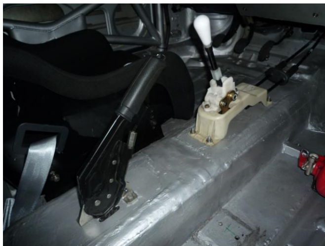
Figura 2 - Posicionamento do comando da caixa de velocidades e travão de mão.

O comando pode ser montado no interior da viatura em cima do túnel. Como figura 2.